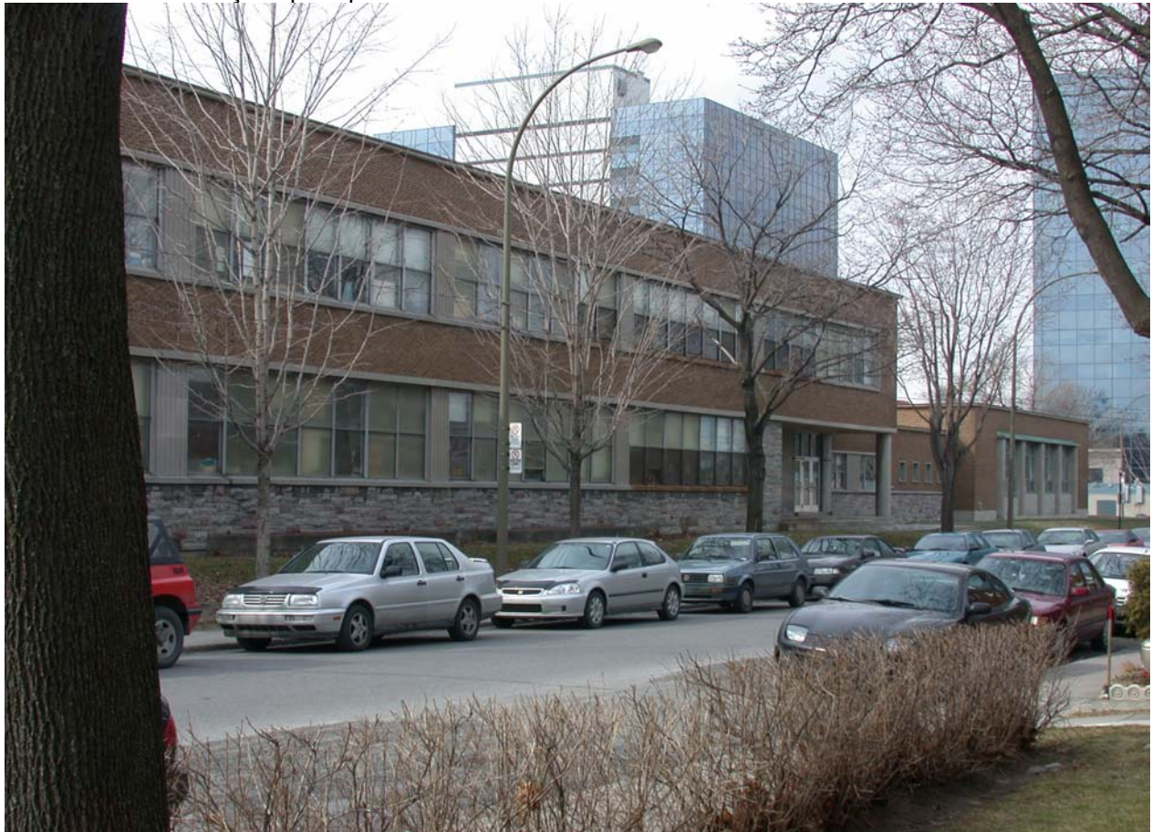
L'école Saint-Pierre-Apôtre, façade sud, rue Clark • Pascale Beaudet et Caroline Tanguay, mars 2000