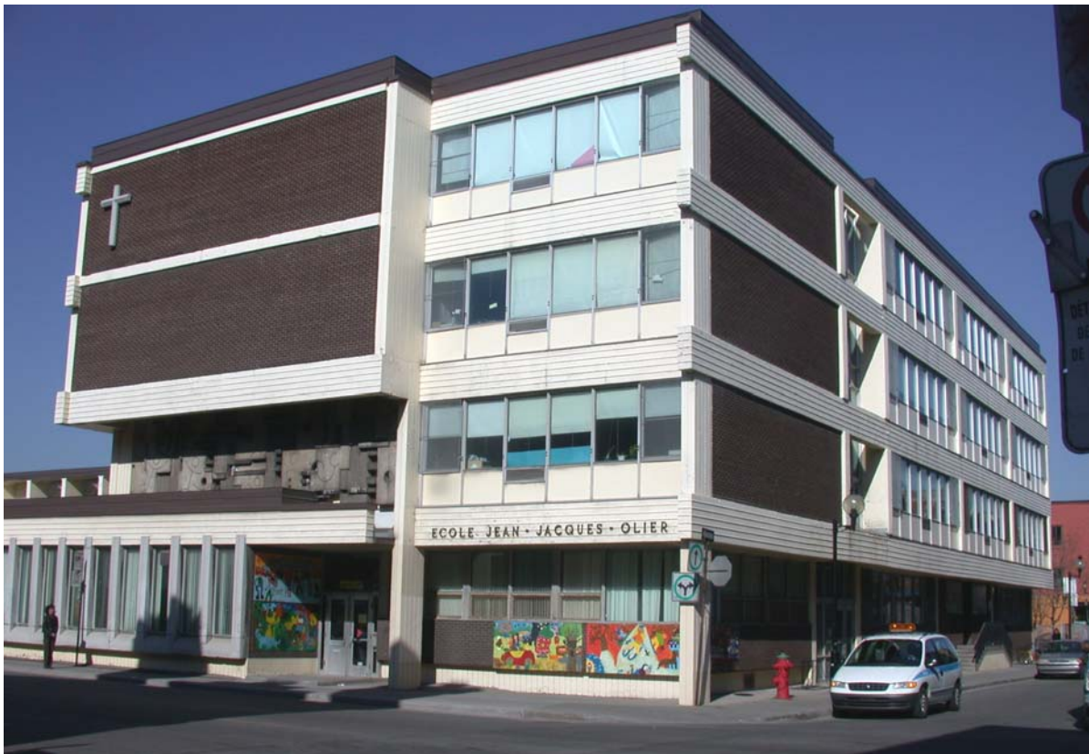
École Jean-Jacques Olier, façades sud et est, à l'angle de l'avenue des Pins et de la rue Drolet • Pascale Beaudet et Caroline Tanguay, avril 2002