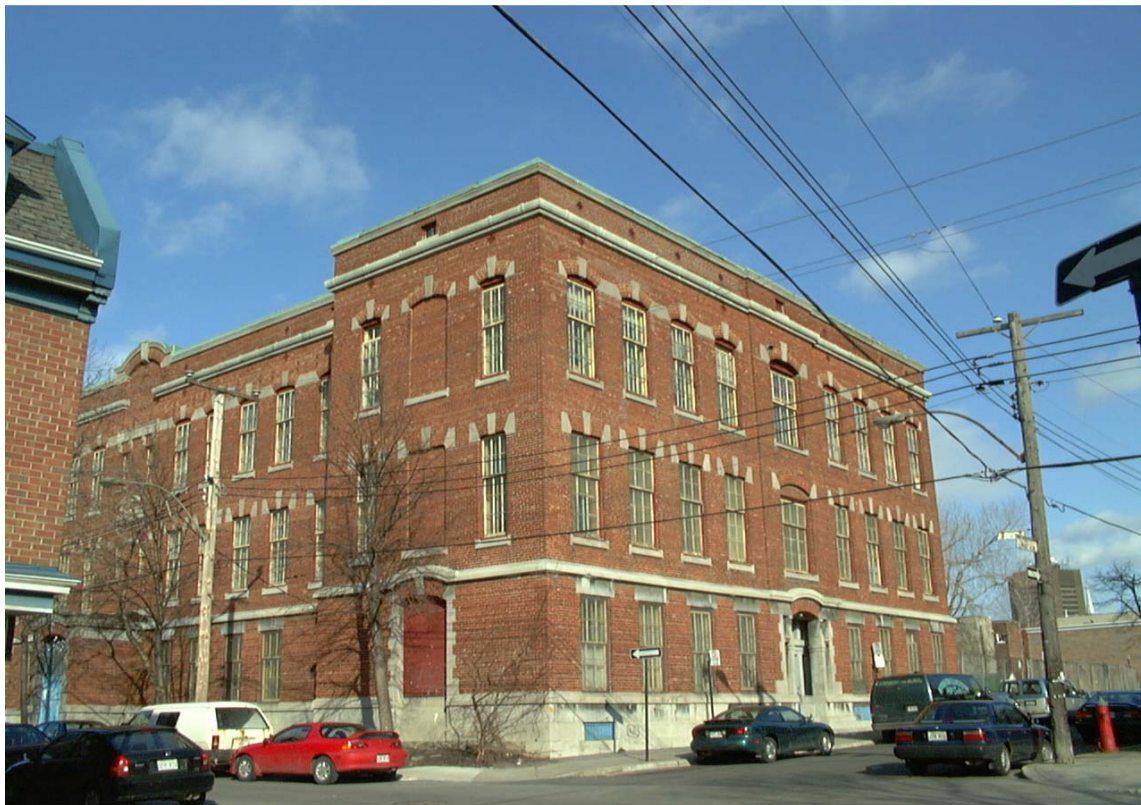
Comité social Centre-sud, façade latérale ouest, rue Montcalm • Pascale Beaudet et Caroline Tanguay, avril 2002