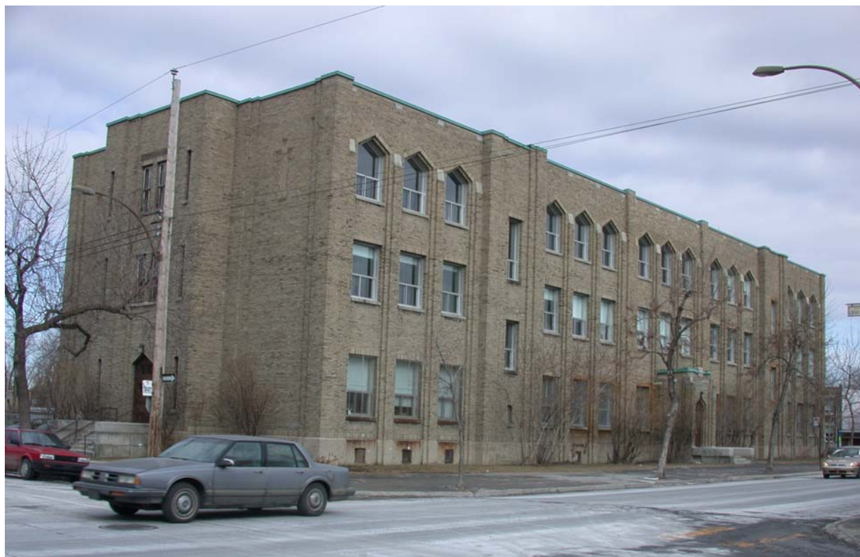
Centre Marie-Médiatrice, façade sud, rue de Bellechasse • Pascale Beaudet et Caroline Tanguay, mars 2002