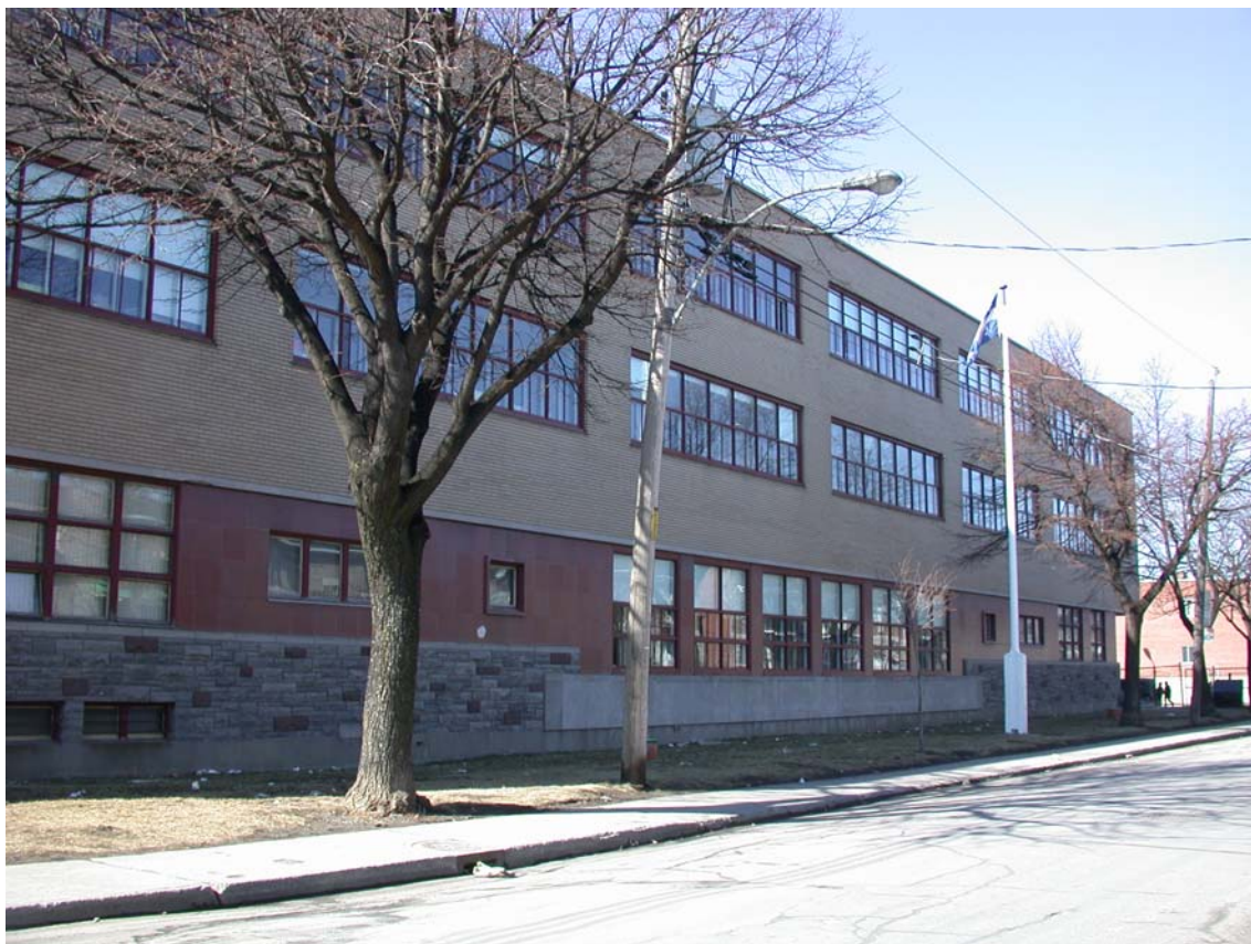
École Saint-Grégoire-le-Grand, façade est, rue Cartier • Pascale Beaudet et Caroline Tanguay, mars 2002