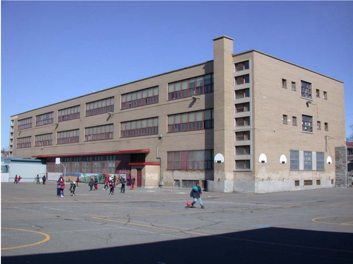
École Saint-Grégoire-le-Grand, façades arrière et latérale • Pascale Beaudet et Caroline Tanguay, mars 2002