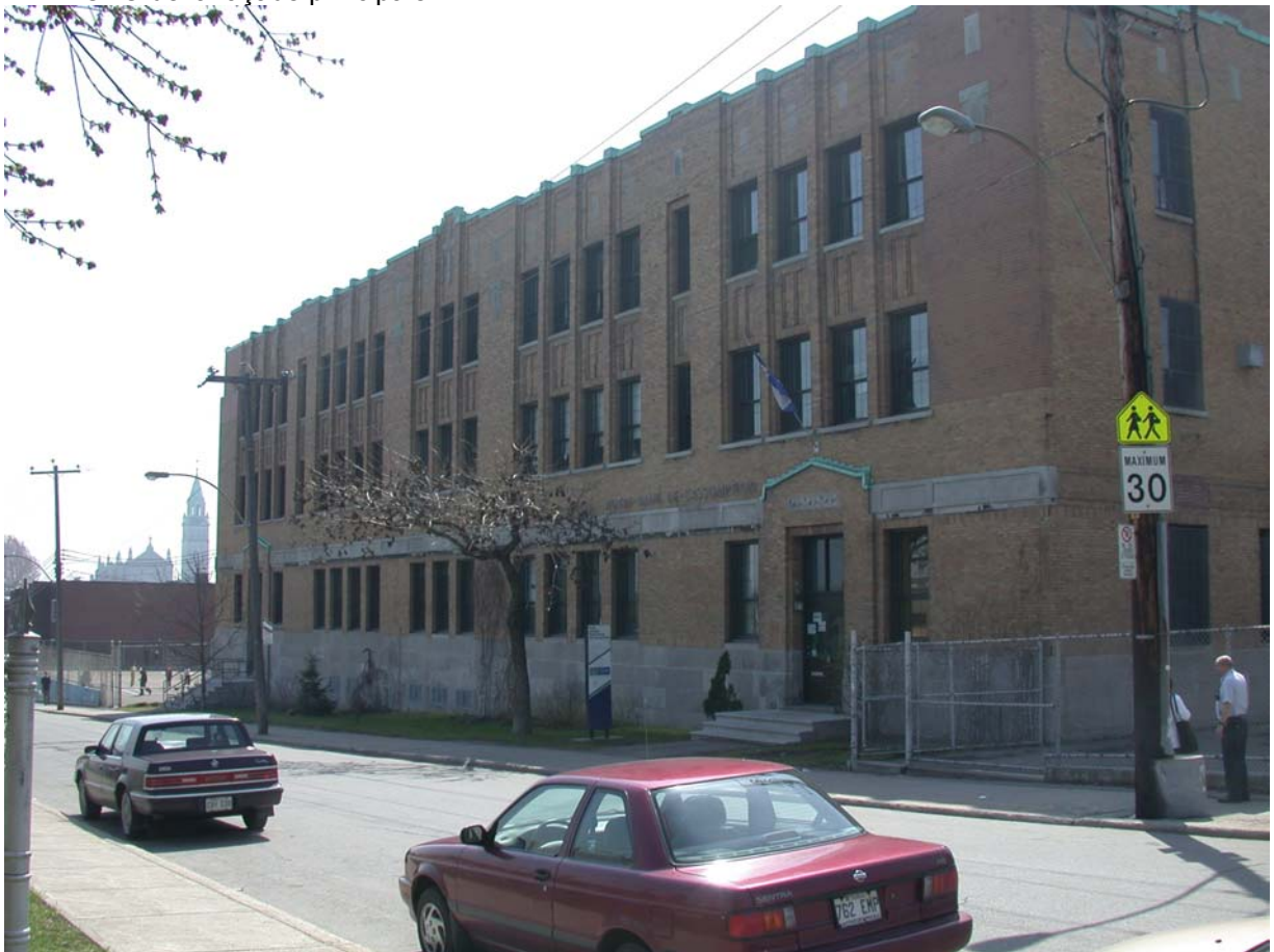
Notre-Dame-de-l'Assomption, façade est, rue Darling • Pascale Beaudet et Caroline Tanguay, avril 2002