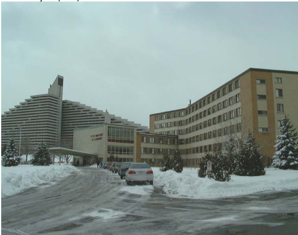
L'école Marguerite-de-Lajemmerais, façade sud, rue Sherbrooke est • Pascale Beaudet et Caroline Tanguay, mars 2002