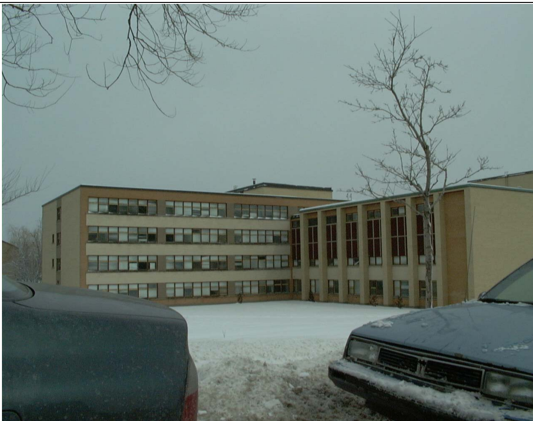
Marguerite-de-Lajemmerais, façade ouest • Pascale Beaudet et Caroline Tanguay, mars 2002