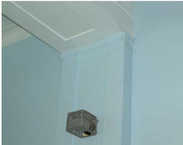
Sans-Frontières, vue de la scène du gymnase à gauche, détail du pilastre à droite • Pascale Beaudet et Caroline Tanguay • mars 2002