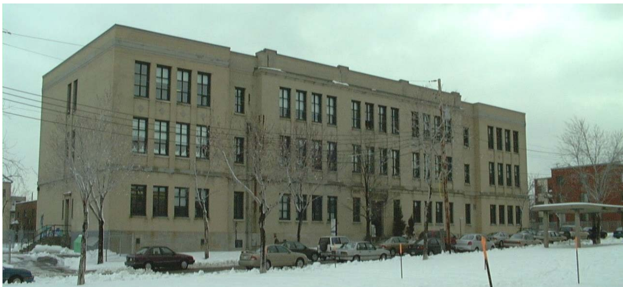
Sans-Frontières, façade ouest, 9 e Avenue • Pascale Beaudet et Caroline Tanguay • mars 2002