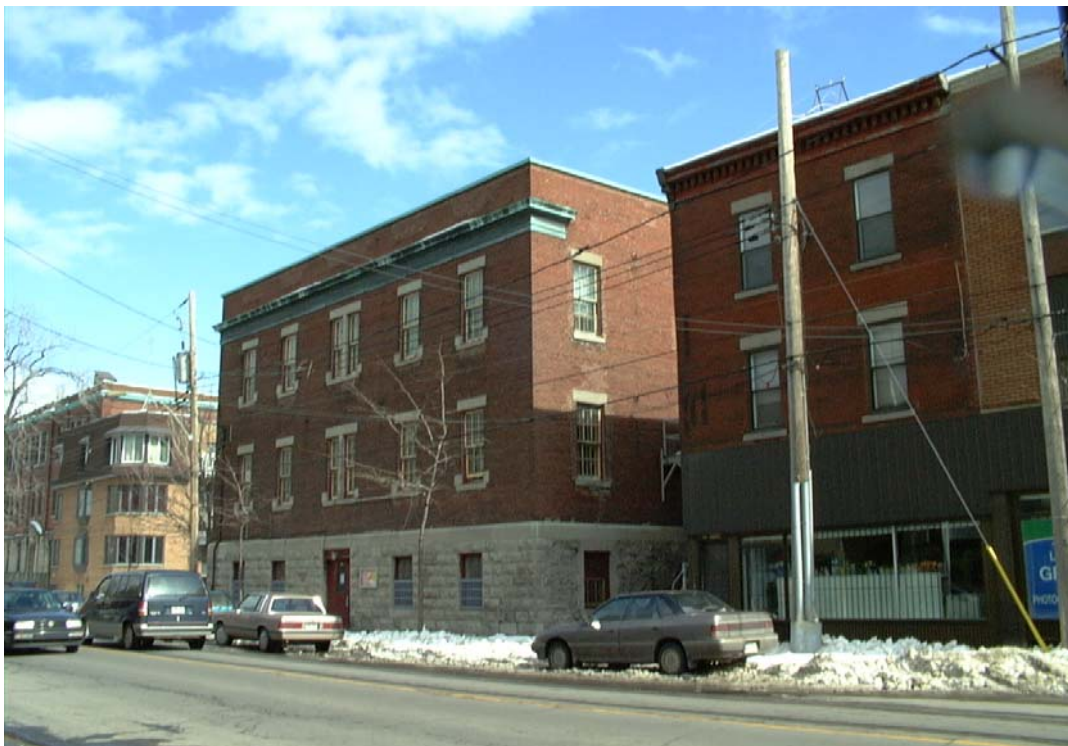
Carrefour d'éducation populaire, façade nord, rue Centre • Pascale Beaudet et Caroline Tanguay, mars 2002